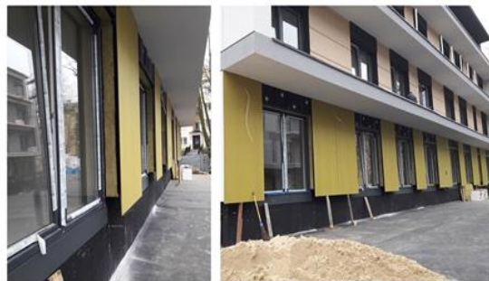
ZDJEŃCIA WYKONANE NA ETAPIE REALIZACJI